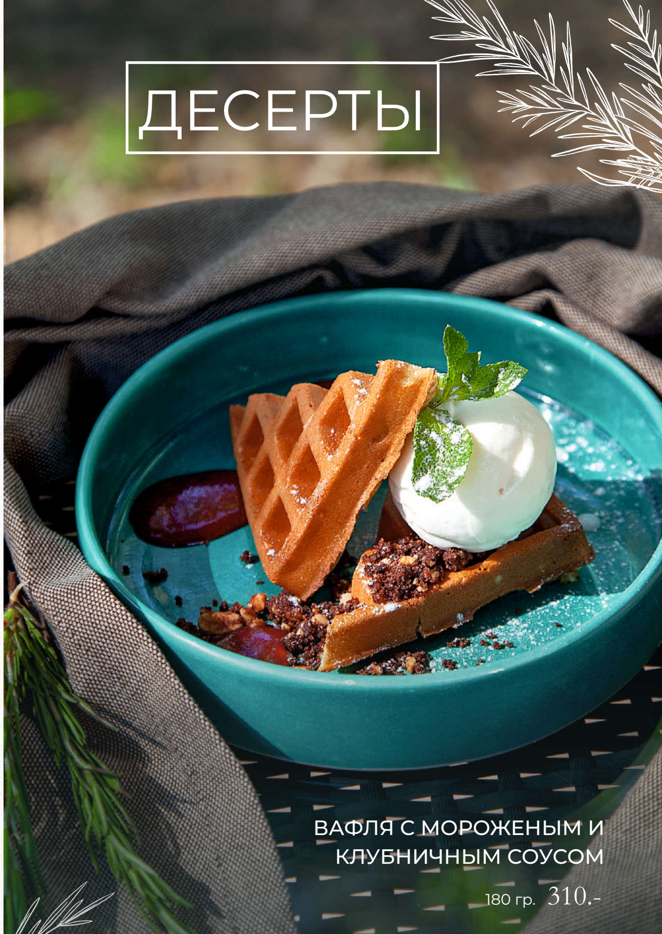
ВАФЛЯ С МОРОЖЕНЫМ И КЛУБНИЧНЫМ СОУСОМ